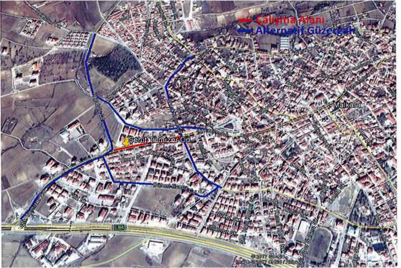
Şehit Temizer Caddesindeki Çalışma

Hürriyet Caddesi 2017/342 Nolu UKOME Kararına ve Şehitlik Caddesi 2015/439 Nolu UKOME Kararına göre günün belirli saatlerinde taşıt trafiğine kapalı olduğu belirtilmektedir. Ancak 14 Kasım Caddesindeki çalışma süresince alternatif güzergâh olmadığından trafik Hürriyet Caddesi ve Şehitlik Caddesi üzerinden sağlanacaktır.