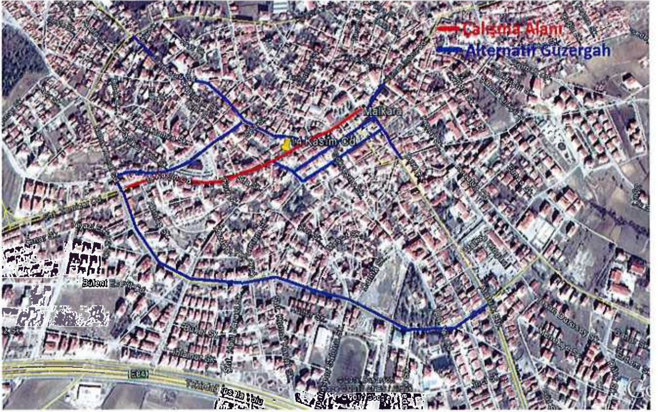
14 Kasım Caddesindeki Çalışma

Hürriyet Caddesi 2017/342 Nolu UKOME Kararına ve Şehitlik Caddesi 2015/439 Nolu UKOME Kararına göre günün belirli saatlerinde taşıt trafiğine kapalı olduğu belirtilmektedir. Ancak 14 Kasım Caddesindeki çalışma süresince alternatif güzergâh olmadığından trafik Hürriyet Caddesi ve Şehitlik Caddesi üzerinden sağlanacaktır.