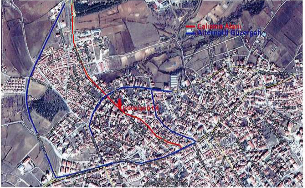
Uzunköprü Caddesindeki Çalışma

Söz konusu çalışma Ulaşım Dairesi Başkanlığı, Trafik Hizmetleri Şube Müdürlüğü tarafından belirlenen alternatif yol güzergâhı üzerindeki tüm araç parklanmaları iş bitimine kadar kaldırılacak olup, parklanma denetlemeleri Trafik Zabıta ekipleri tarafından yapılacaktır. Karayolları Genel Müdürlüğü'nün şehir içi yollarında bakım ve onarım sahalarında işaretleme standartları el kitapçığı, bölünmüş ve iki yönlü yollarda yapım, bakım ve onarım sahalarında trafik işaretleme şekline uygun olarak Tekirdağ Büyükşehir Belediyesi Aykome Çalışma Yönetmeliği Bölüm 2, 11. Madde 12.bendi gereğince yüklenici firma/ ilgili kurum tarafından yapılacaktır.