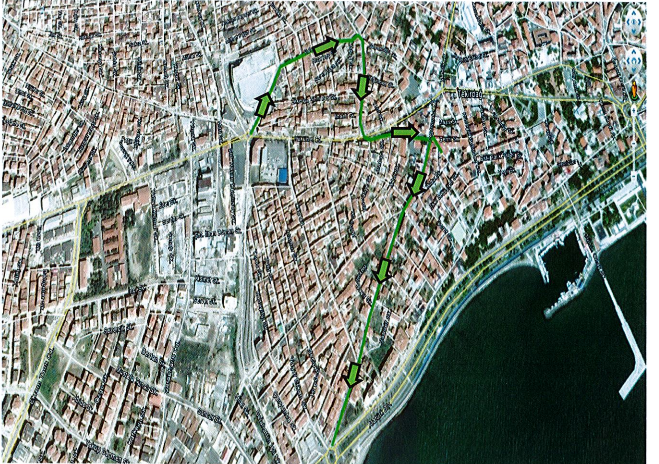
Şekil-1: Revize edilen güzergâh

KARAR: Komisyon tarafından mahallinde yapılan incelemelerde; Değişmesi talep edilen güzergâh Şekil-1 de gösterilmiştir.