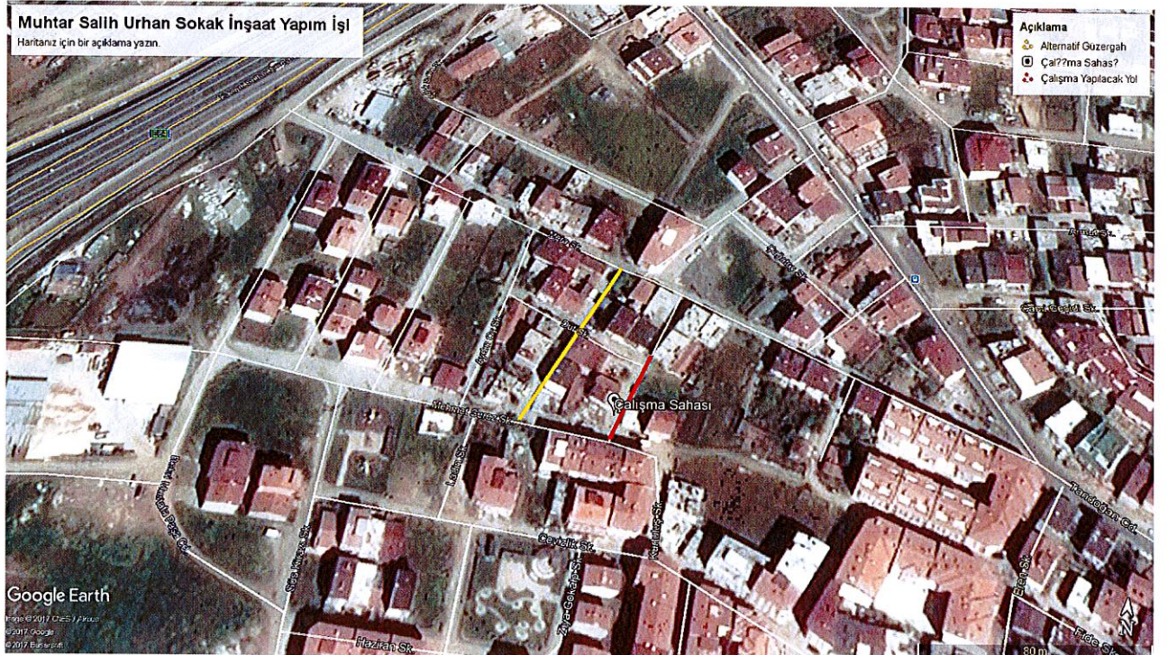
Muhtar Salih Urhan Sokak

Tekirdağ İli, Süleymanpaşa İlçesi Çınarlı Mahallesi Muhtar Salih Urhan Sokak 1883 ada 8 parseldeki taşınmazda inşaat çalışmasında çalışmanın güvenli bir şekilde yapılması ve vatandaş mağduriyeti yaşanmaması için Muhtar Salih Urhan Sokağın yayalar için gerekli güvenlik tedbirlerinin alınması koşulu ile güçlendirme çalışması yapılmıncaya kadar (29/11/2017) araç trafiğine kapatılmasına komisyonumuz tarafından oy birliği ile karar verilmiştir.