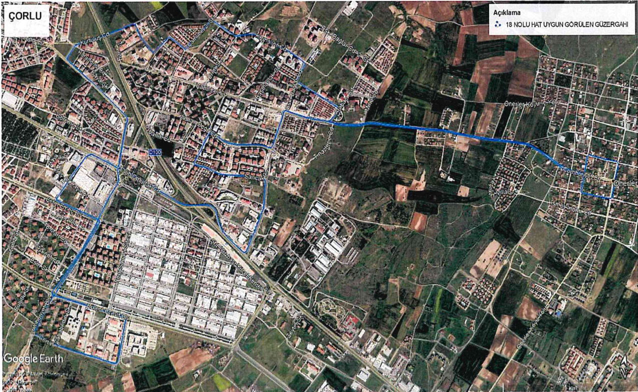
Kroki - 1 -

Tekpark (Tekulaş) Tekirdağ Otopark Ulaşım Nak. İmar Plan İnş. ve Taah. San. ve Tic. A.Ş.'nin 18 Nolu hat ile 18-A Nolu hattın birleştirilerek tek hat yapılmasına Kroki -1- de belirtilen güzergahı kullanmasına, kroki 2 de belirtilen 10-C nolu hattın mavi ile belirtilen güzergahı kullanarak mevcut güzergahına (kroki-2 de sarı) bağlanmasına komisyonumuz tarafından oy birliği ile karar verilmiştir.