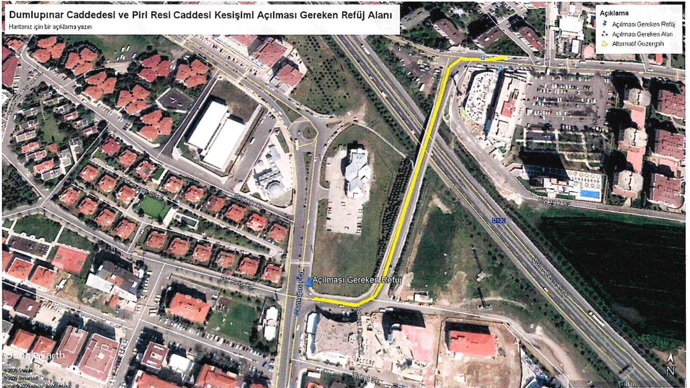
Kroki - 2 – Açılması Gereken Refüj Alanı