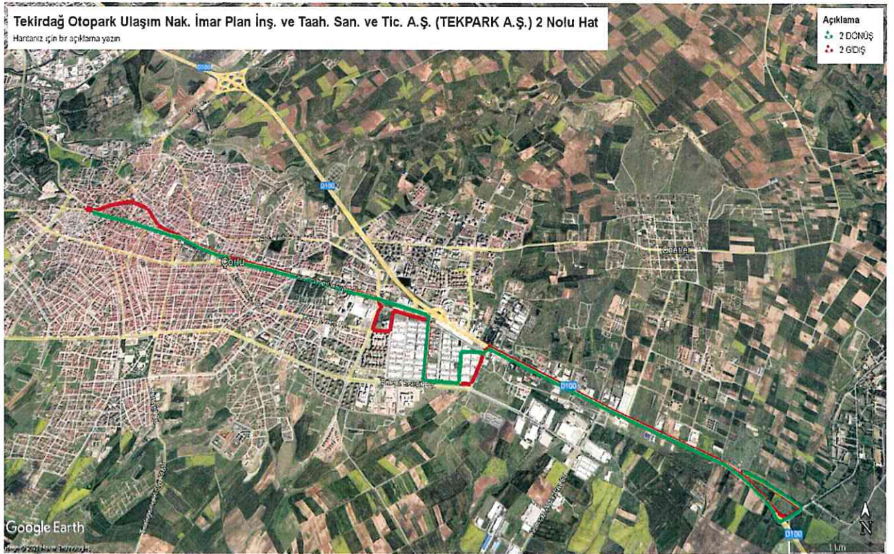
Kroki - 3