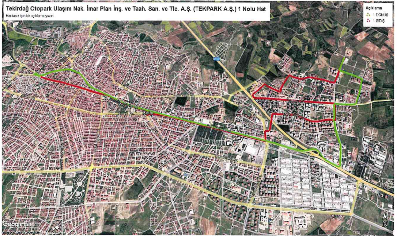
Kroki - 2