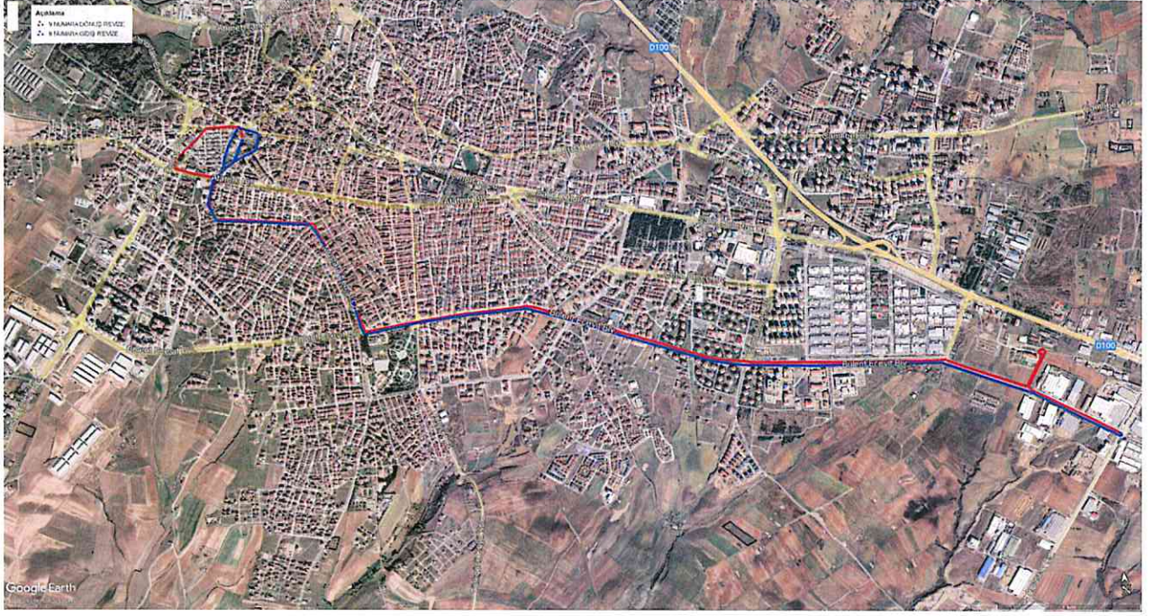
Kroki - 2 - Revize Güzergah