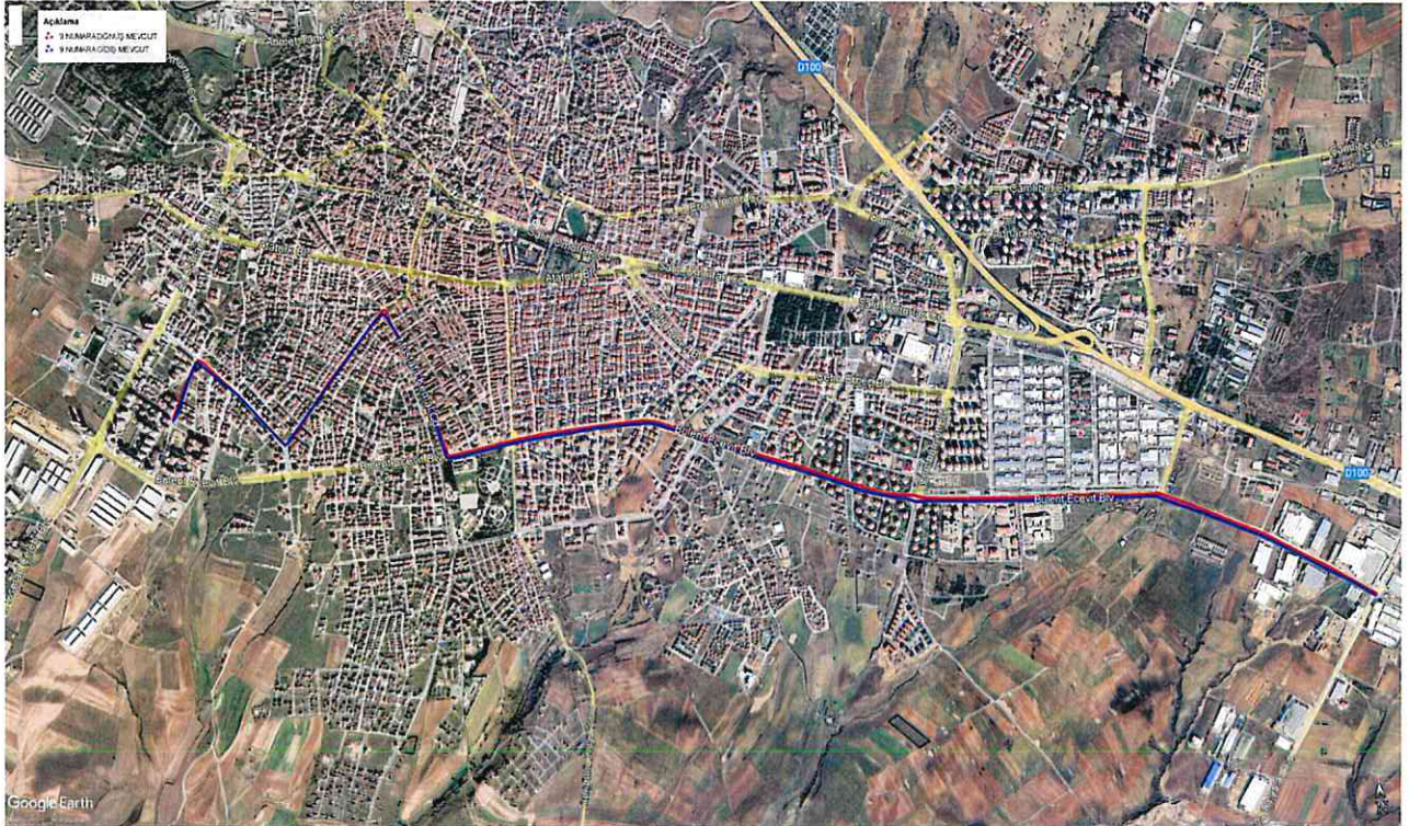
Kroki - 1 - Mevcut Güzergah

İlimiz Çorlu İlçe merkezinde toplu taşıma hizmeti veren Tekirdağ Otopark Ulaşım Nak. İmar Plan İnş. ve Taah. San. ve Tic. A.Ş.'nin 9 Nolu hatta ekte sunulan güzergahta (Kroki 2) Tekirdağ Otopark Ulaşım Nak. İmar Plan İnş. ve Taah. San. ve Tic. A.Ş. ye ait araçların hizmet vermesine komisyonumuz tarafından oy birliği ile karar verilmiştir.